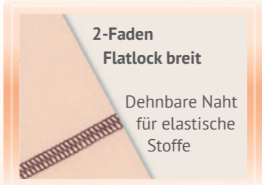
2-Faden Flatlock breit