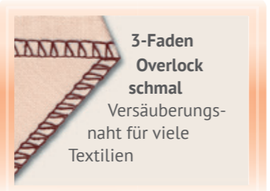
3-Faden Overlock schmal