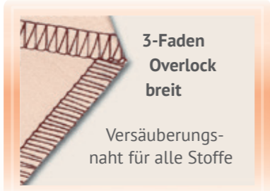
3-Faden Overlock breit

Robuste Naht für die Verarbeitung der meisten Stoffe