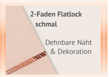
2-Faden Flatlock schmal